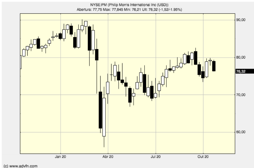
Gráfico anual da Philip Morris – br.advfn.com

Fontes: The Street, CNBC, FX empire, FX Street, Wall Street, Reuters