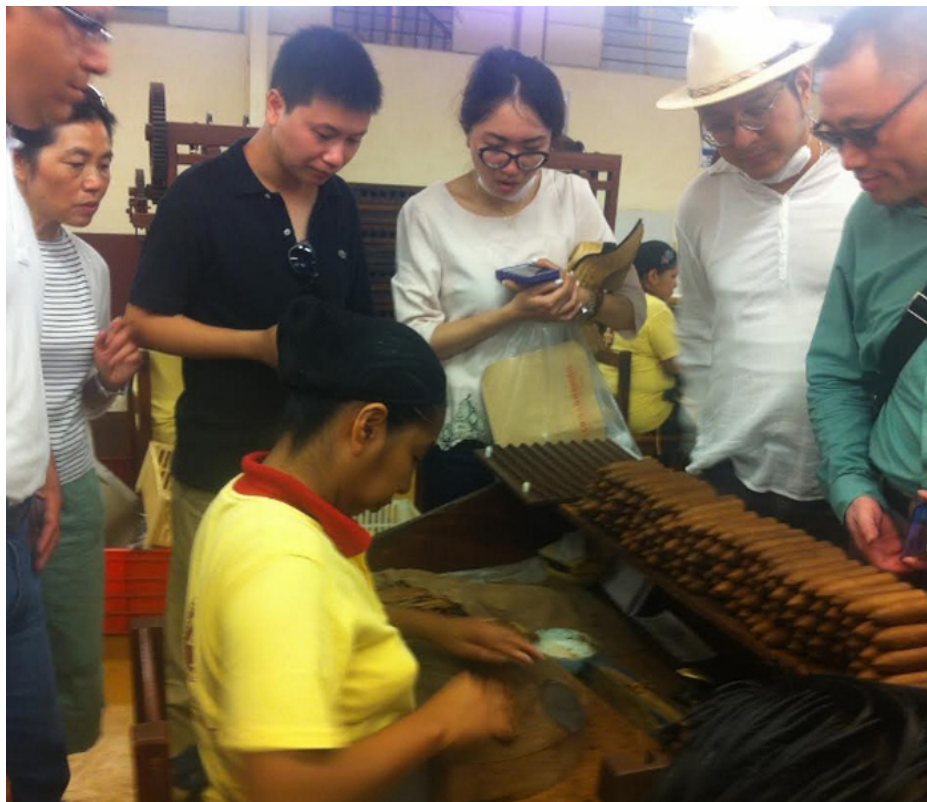
El Instituto ha apoyado a delegaciones comerciales de diversos continentes interesados en comprar productos en beneficio de pequeños productores con poco acceso a mercados internacionales.

México. El Instituto Interamericano de Cooperación para la Agricultura (IICA) apoyó la visita que realizó una misión de delegados de China a México interesada en adquirir tabaco en rama y puros para crear alianzas que les permitan contar con un socio estratégico en la producción de esta planta.