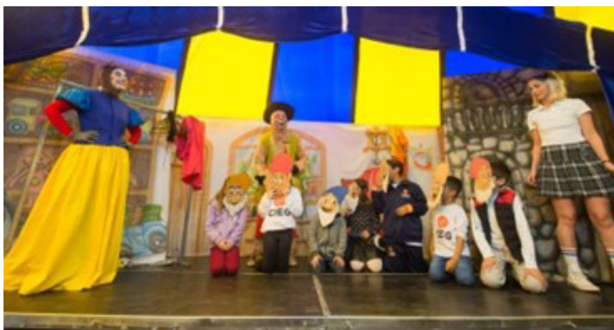
Peça infantil é patrocinada pela Universal Leaf por meio da Lei de Incentivo à Cultura