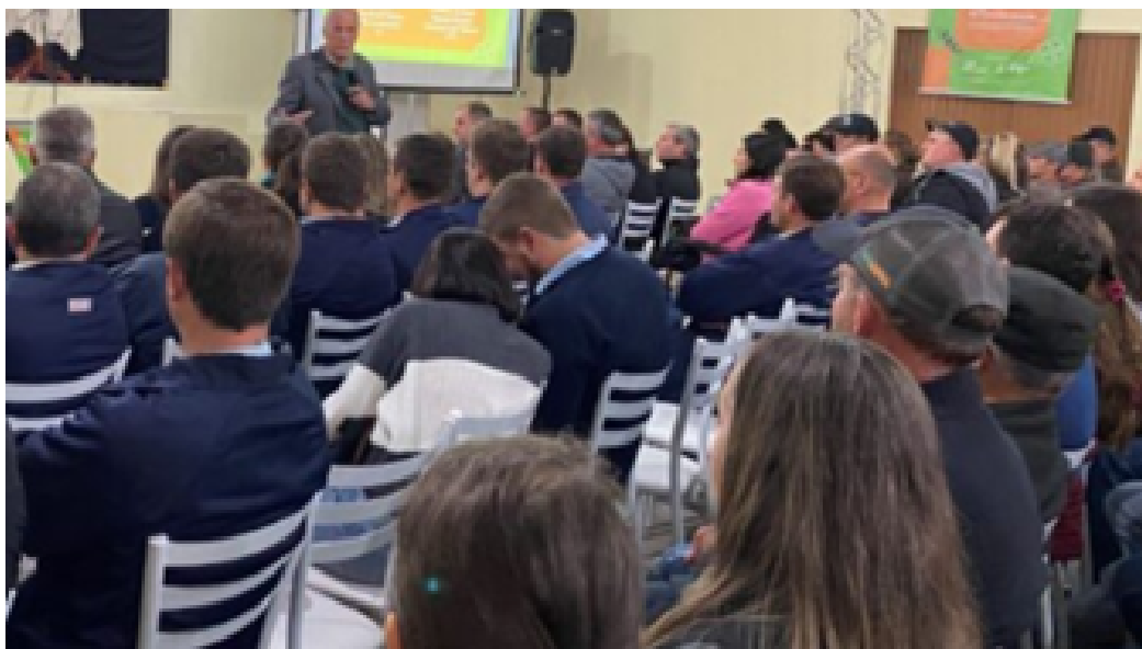
SindiTabaco e Afubra promovem evento em Cerro Branco

a. O SindiTabaco e a Afubra promoveram um evento na cidade de Cerro Branco, no Rio Grande do Sul, para discutir saúde e segurança do produtor e proteção de crianças e adolescentes. Mais de 300 pessoas, entre agricultores, agentes de saúde, diretores de escolas públicas, conselheiros tutelares e outras autoridades estiveram presentes no evento, que aconteceu em junho de 2022 76 .