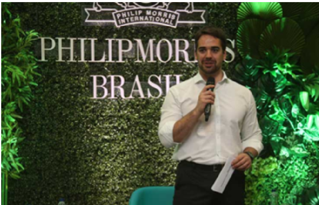
Leite visita Philip Morris e apoia produção e venda de cigarros eletrônicos e produtos de tabaco aquecido