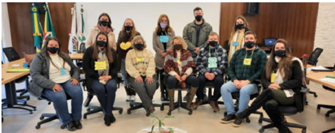
Crescer Legal promove um seminário para professores

Em julho de 2021, o Instituto promoveu um seminário para professores e outros funcionários para falar sobre educação na pandemia e questões comuns que surgem durante a adolescência 59 .