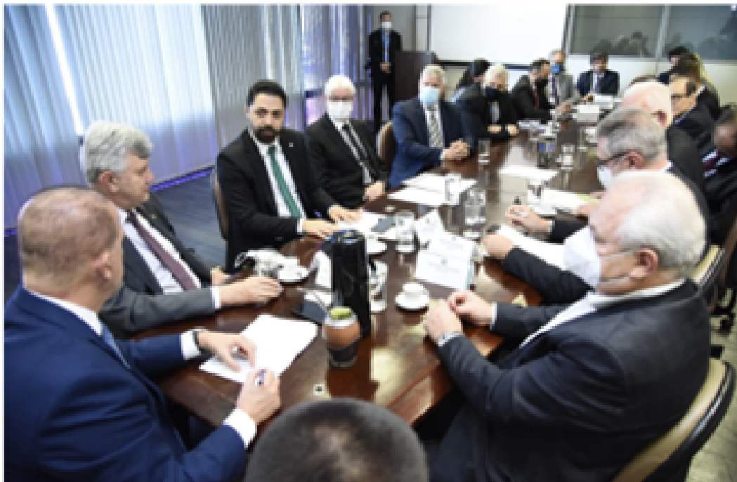
Lorenzoni se reúne com membros da Câmara Setorial do Tabaco para falar sobre a COP 9