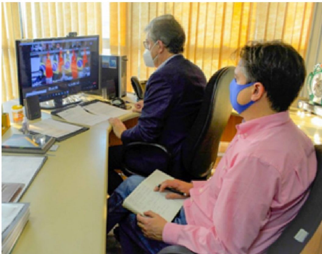
Reunião remota entre a Secretaria de Desenvolvimento Econômico do Rio Grande do Sul e a embaixada da China