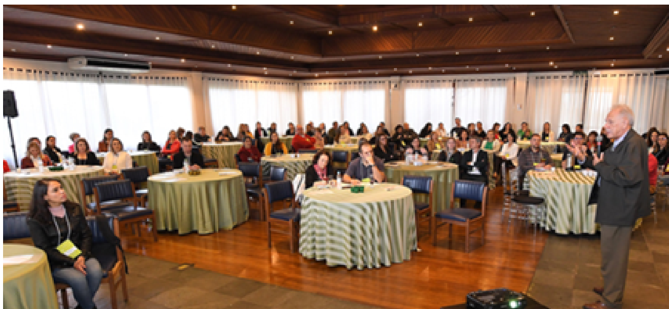
Seminário sobre trabalho infantil organizado pelo Insituto Crescer Legal

Instituto e vice-diretora da Faculdade de Direito da Universidade Federal do Rio Grande do Sul (UFRGS).