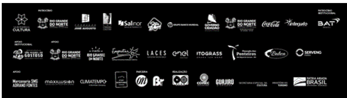
Logotipo da BAT Brasil aparece junto com diversos órgãos governamentais no site do festival de cinema de São Miguel do Gostoso