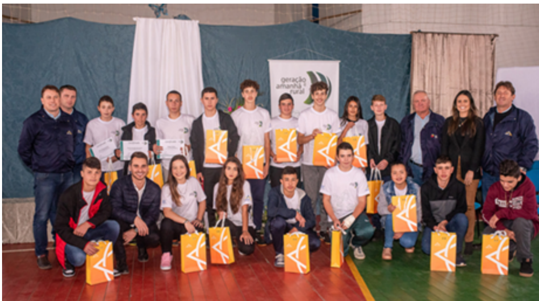
Estudantes que participaram da capacitação