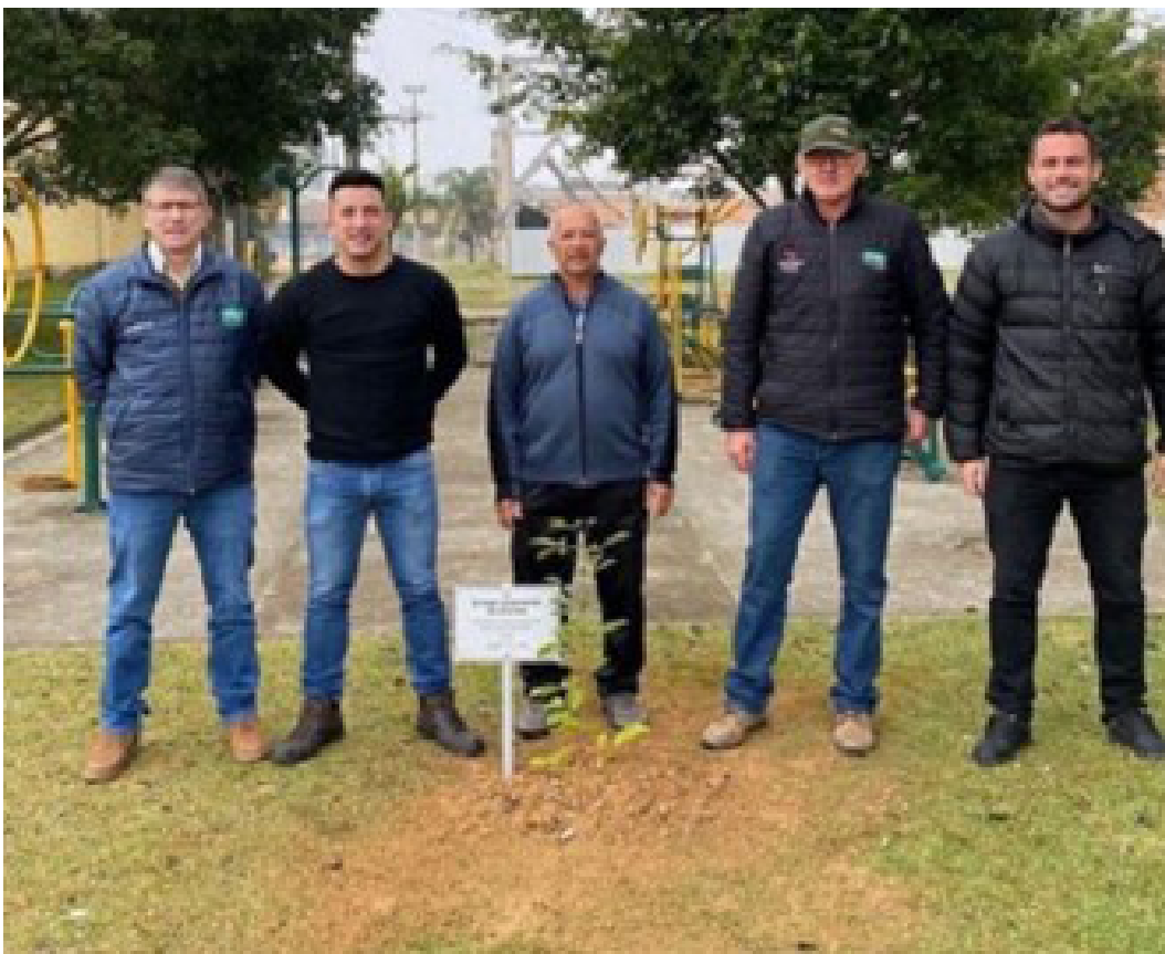
Um ipê amarelo foi plantado para comemorar a parceria com a Afubra

g. Em 2022, o projeto firmou uma parceria com o município de Candelária nas atividades do Dia Mundial do Meio Ambiente. Na ocasião, lixo eletrônico foi recolhido e trocado por mudas 73 .