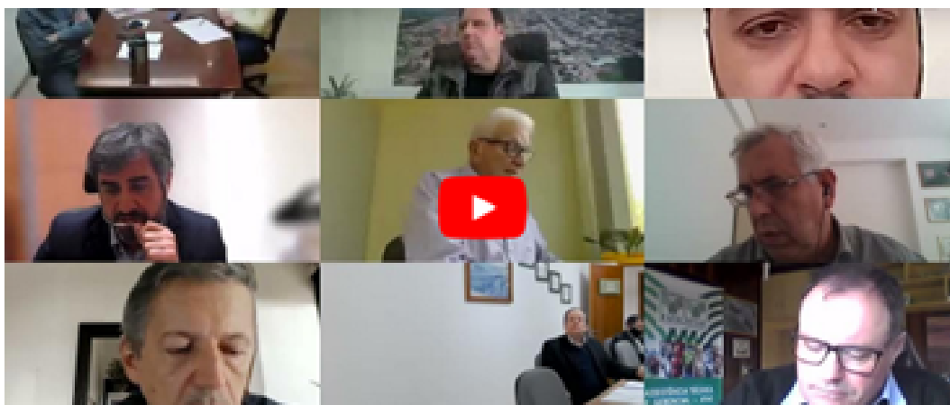
Captura de tela do registro em vídeo da reunião em que representantes da indústria e membros do governo e do Congresso discutiram a extinção da CONICQ e outros tópicos de interesse da indústria do tabaco

Mais detalhes sobre as atividades dos parlamentares e os efeitos da extinção da CONICQ estão incluídos em outras perguntas deste questionário.