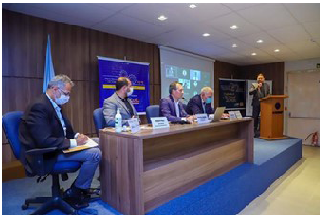
Encontro entre a Frente Parlamentar da Indústria e representantes do SindiTabaco e outras indústrias

Membros da Frente Parlamentar da Indústria do Rio Grande do Sul se reuniram com representantes do SindiTabaco e outras indústrias para ouvir suas demandas 24 .