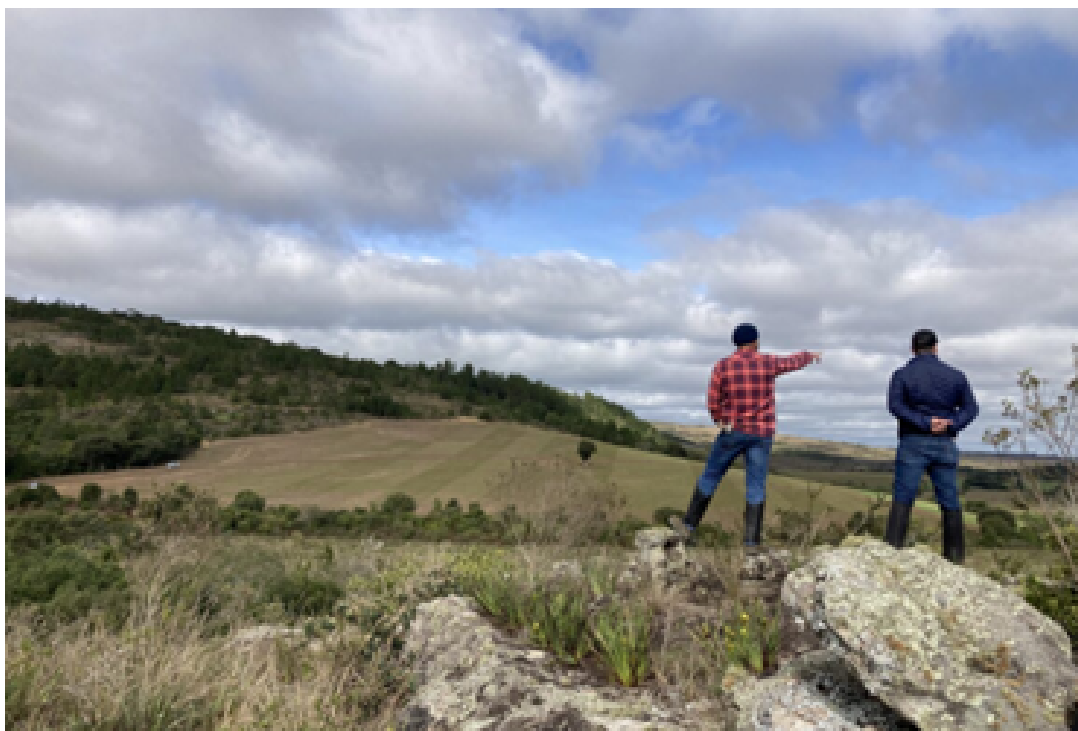
O projeto Conexão Araucária é financiado pela JTI