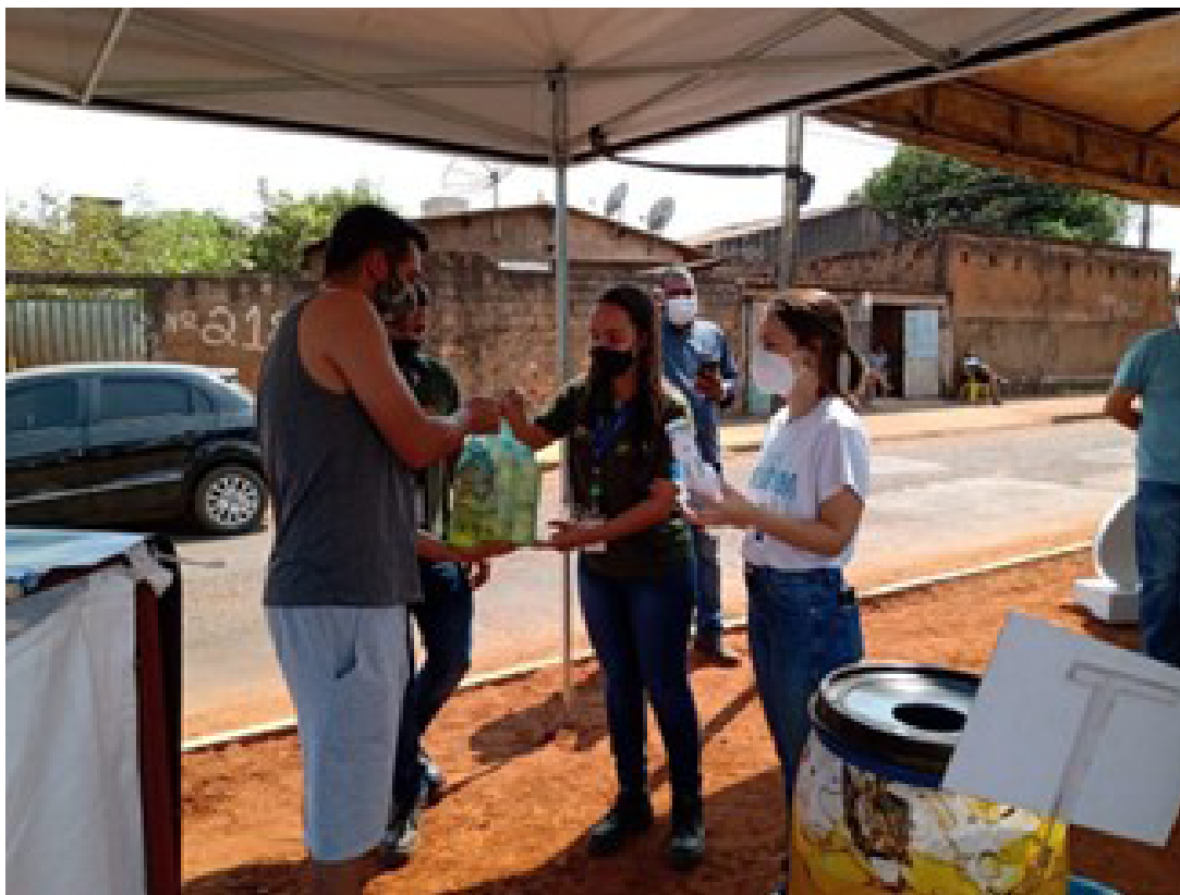
Evento do Dia Mundial da Limpeza com Souza Cruz/BAT Brasil em Uberlândia

d. A Souza Cruz/BAT Brasil firmou uma parceria com o Departamento Municipal de Água e Esgoto e a Secretaria Municipal de Meio Ambiente de Uberlândia, Minas Gerais, e recolheu mais de 100 kg de materiais recicláveis e 160 litros de óleo durante o Dia Mundial da Limpeza de 2021 95 .