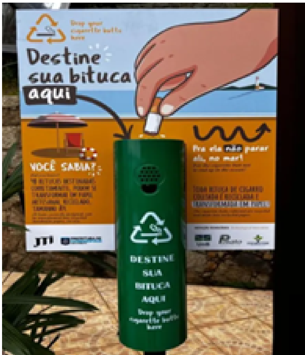
Coletor de bitucas em Florianópolis, Santa Catarina. Os logotipos da JTI, da cidade de Florianópolis e da Poiato estão expostos.