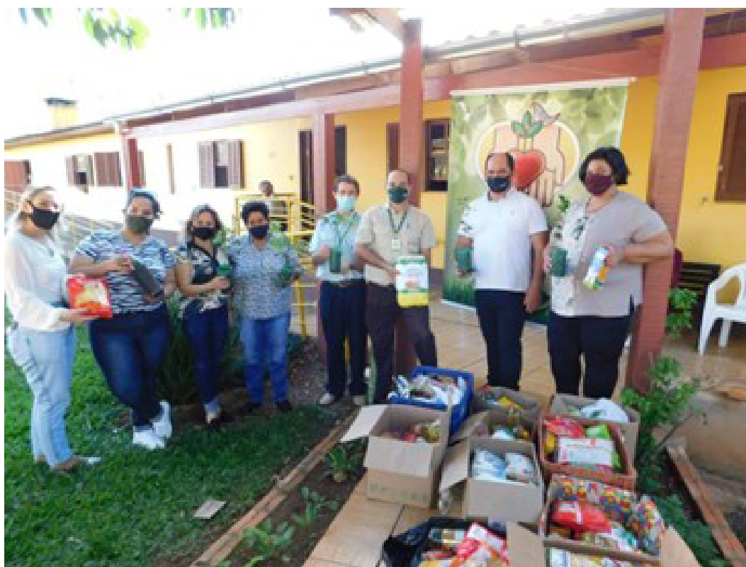
Alimentos coletados e doados pela Afubra a entidades assistenciais