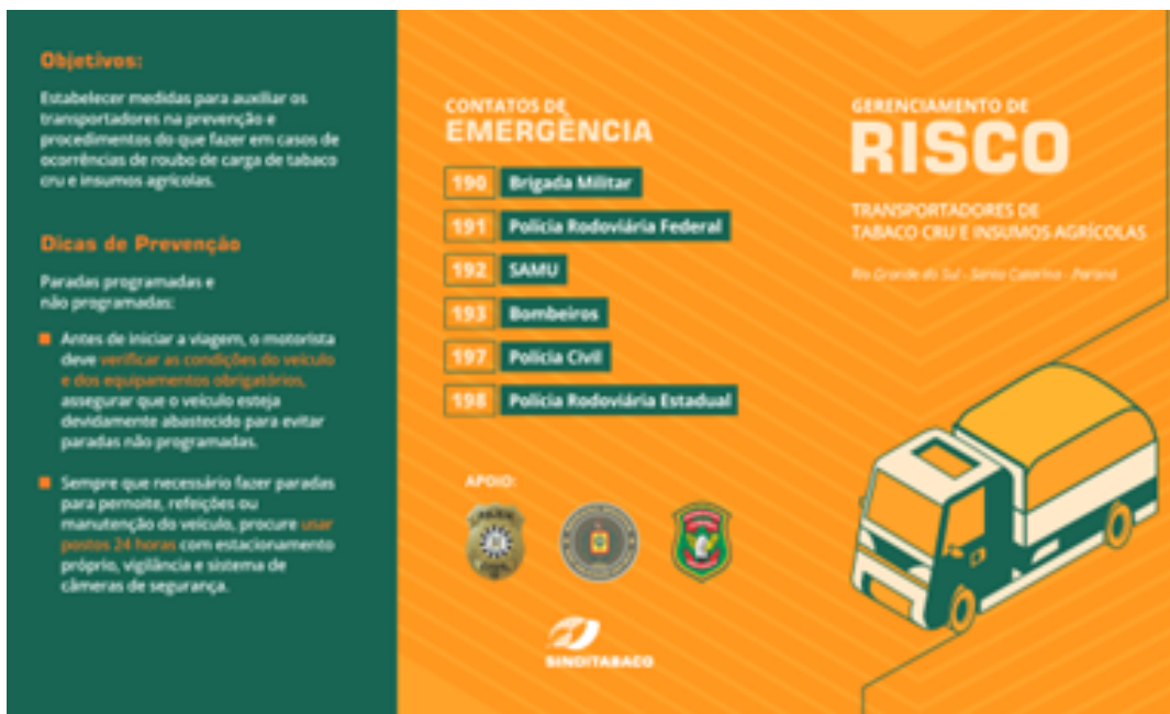
Folder do SindiTabaco produzido em parceria com a polícia

Sul, de Santa Catarina e do Paraná. Além disso, a comissão do SindiTabaco também promoveu outras ações, como padronização de regras de segurança e boas práticas entre as empresas de tabaco, mapeamento de zonas críticas e informe dos resultados aos órgãos de segurança pública e divulgação de indicadores e ações realizadas.