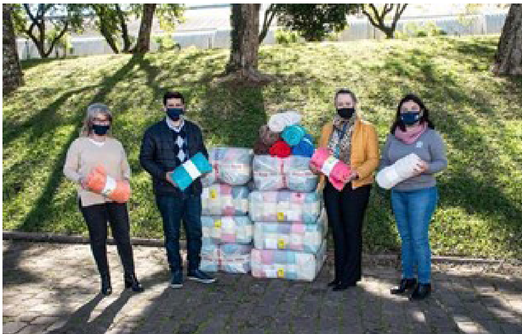
A Secretaria Municipal de Habitação, Desenvolvimento Social e Esporte recebeu mantas doadas pela Universal Leaf