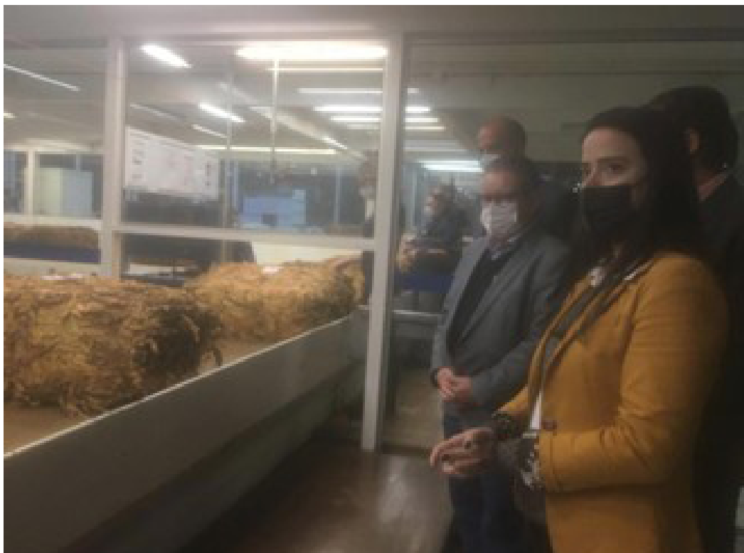
Vieira Júnior visita unidade de processamento de tabaco da BAT Brasil

cargo de governador até janeiro de 2023. Em maio, dois meses depois de assumir o governo, Vieira Júnior visitou uma unidade de processamento de tabaco da BAT Brasil e disse que a visita ajudaria a integrar o combate ao comércio ilícito.