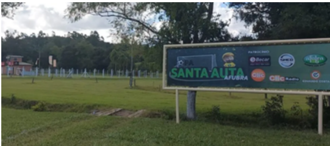
Logo da Afubra em um anúncio do evento

f. A Afubra nomeou, patrocinou e promoveu um evento esportivo, a Copa Santa Auta Afubra, com campeonatos de futebol, vôlei e bocha. Os jogos incluíram categorias para adolescentes e premiações 82 .