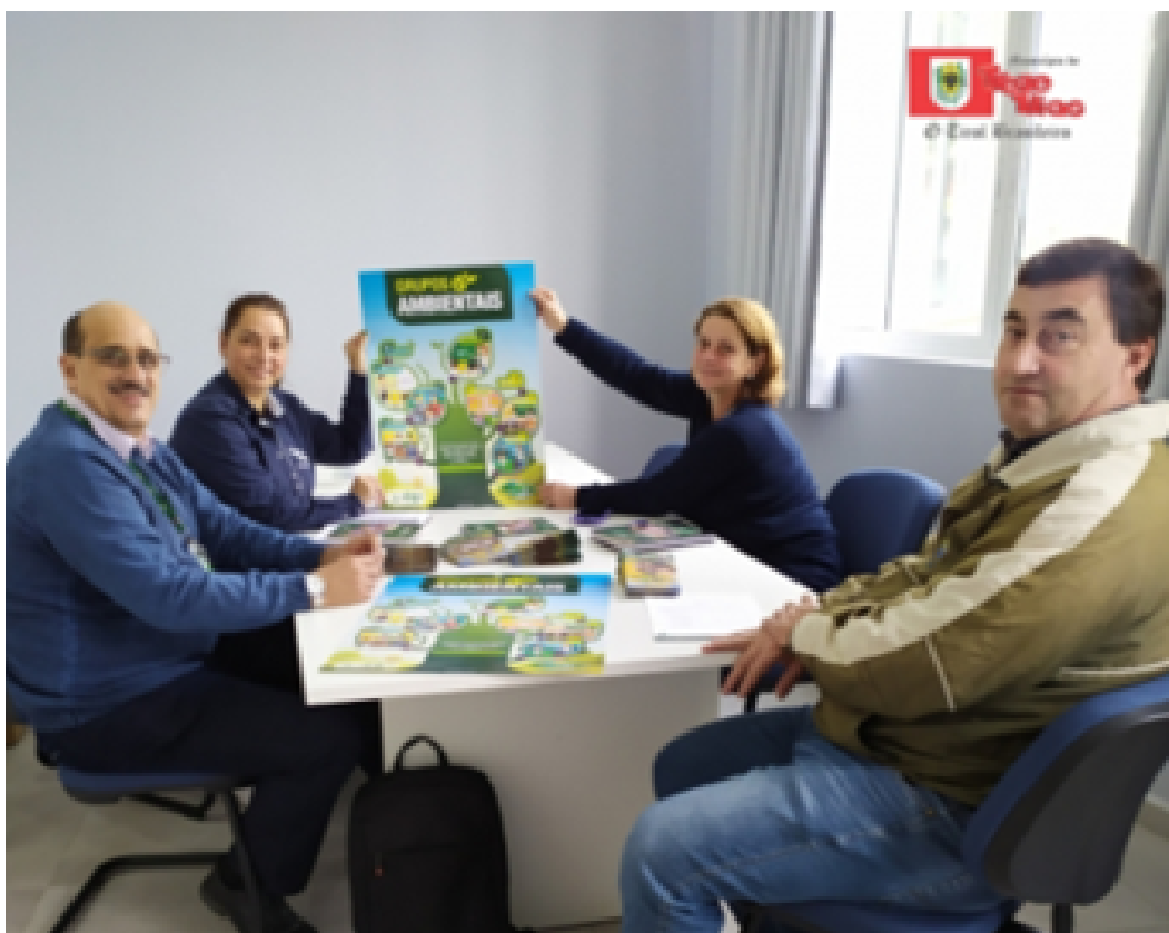
O município de Treze Tílias renovou a parceria para implementar o projeto Verde É Vida em uma escola pública

d. A prefeitura de Treze Tílias também renovou a parceria para implementar o projeto em uma escola pública, com o tema “Planeta sustentável: agir localmente e pensar globalmente” 70 .