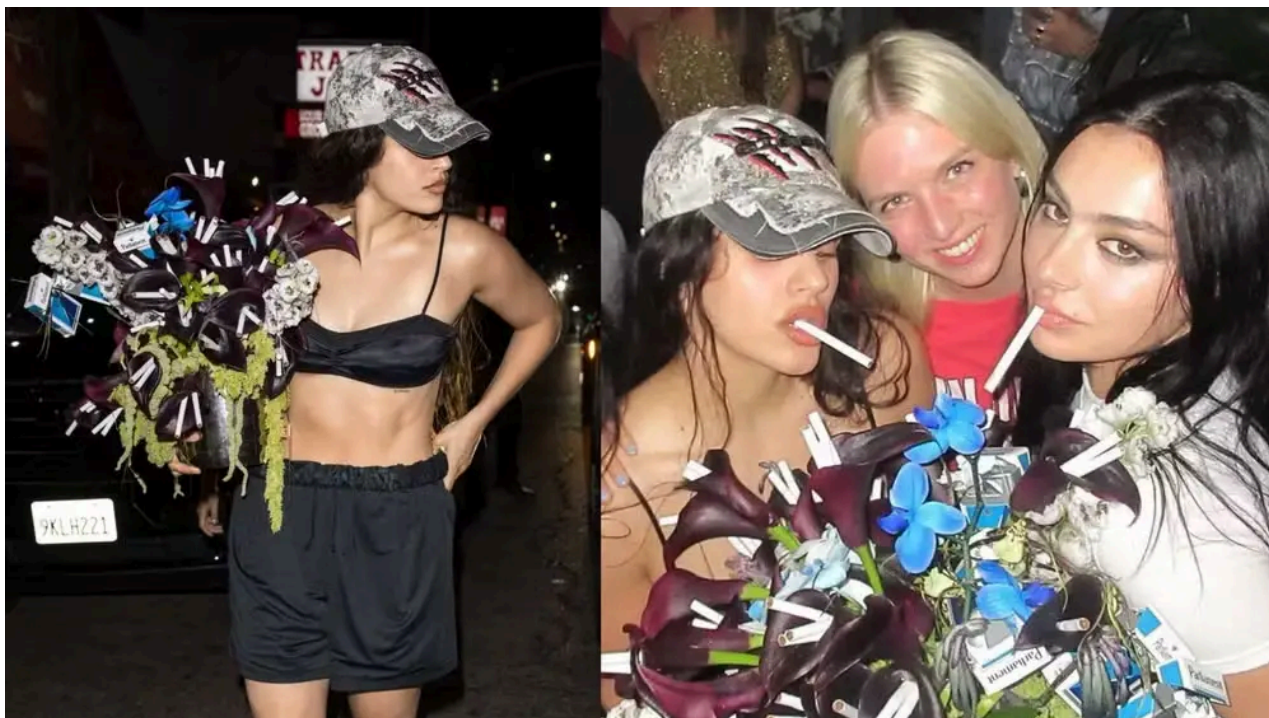
A cantora espanhola Rosalía entrega um buquê de cigarros no aniversário da britânica Charli XCX.