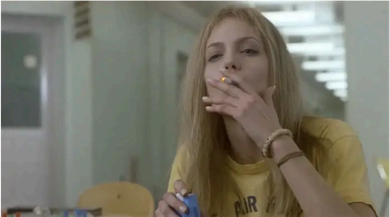
Lisa Rowe, interpretada por Angelina Jolie, no filme “Garota, Interrompida” de 1999.