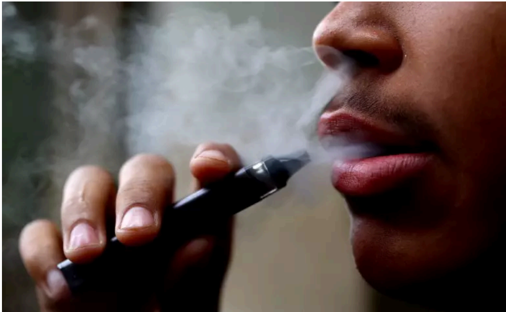
Homem usa vape no Reino Unido 14/9/2023

A venda de vapes de uso único será proibida na Inglaterra a partir de junho do próximo ano, informou o governo britânico nesta quinta-feira, buscando conter os danos ambientais e os níveis crescentes de uso entre adolescentes.