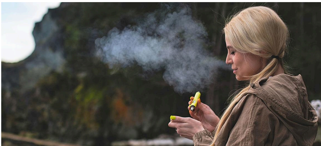
Vaping envolve aquecer um líquido e inalar o aerossol nos pulmões