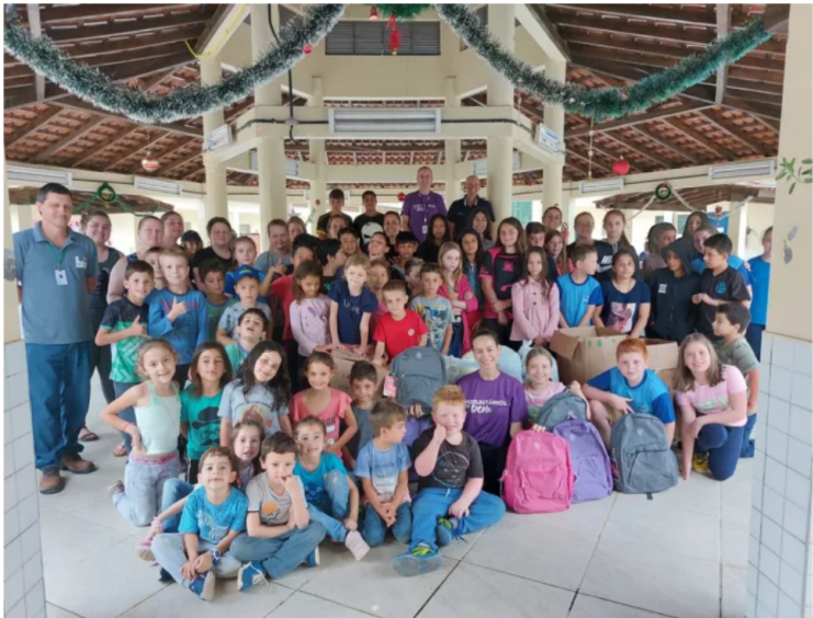
Ação visa auxiliar a retomada do ano letivo em 2025, principalmente em áreas afetadas pelas enchentes ocorridas no Rio Grande do Sul em 2024

Doze municípios do Rio Grande do Sul foram contemplados com uma ação promovida pela Japan Tobacco International (JTI) que beneficiou 1,5 mil alunos de 18 escolas. Por meio do Programa Voluntários do Bem, a empresa doou kits de material escolar, auxiliando na retomada do ano letivo de 2025, principalmente em áreas afetadas pelas enchentes ocorridas na região em maio. A entrega dos kits, compostos por mochila, cadernos, lápis, canetas, tesoura, entre outros itens, iniciou no final do mês de outubro e encerrou na terça-feira, 17 de dezembro.