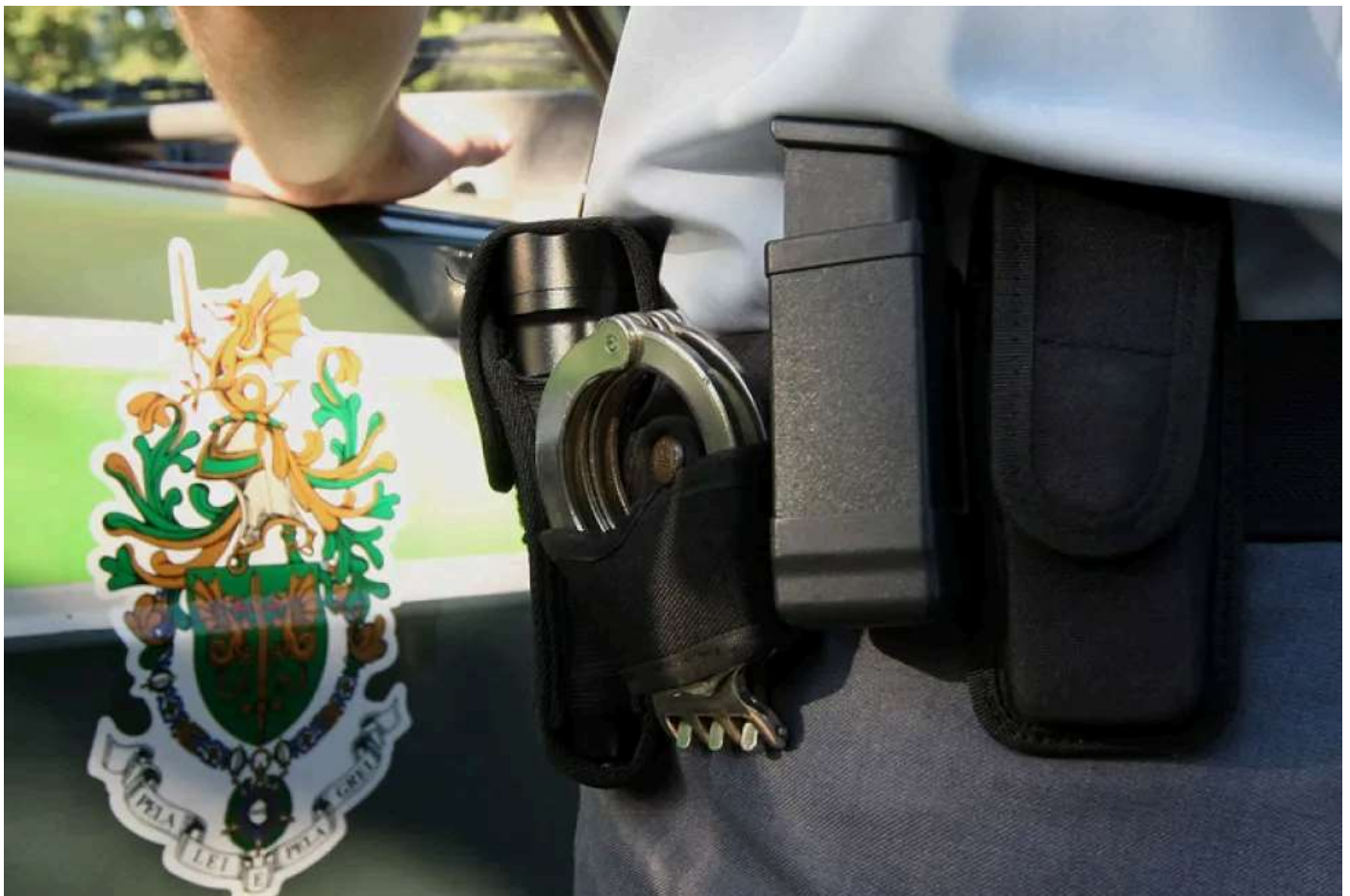
Guarda apreendeu tabaco de contrabando e bebidas alcoólicas